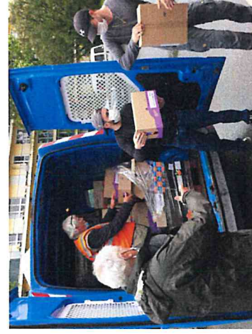
Livraison par un bénévole de la BA au Village Alimentaire.