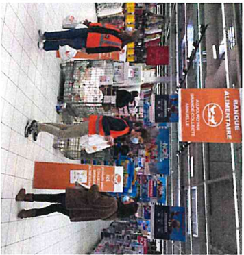
Deux jeunes bénévoles proposant des sacs préparés (Carrefour Alma).