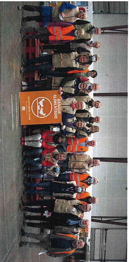
Des bénévoles encore plus investis en raison de la crise sanitaire.

La mise en œuvre de nouvelles actions de promotion des dons (sacs préparés, collecte dématérialisée, meilleure implication des magasins...) a dynamisé la Collecte Nationale des 27 et 28 novembre 2020 qui s'est pourtant déroulée dans un contexte sanitaire inédit. Grâce à la mobilisation de 3500 bénévoles répartis dans 146 magasins, elle a permis de récolter 255 tonnes de produits secs contre 176 tonnes en 2019, soit un bond de 45 %.