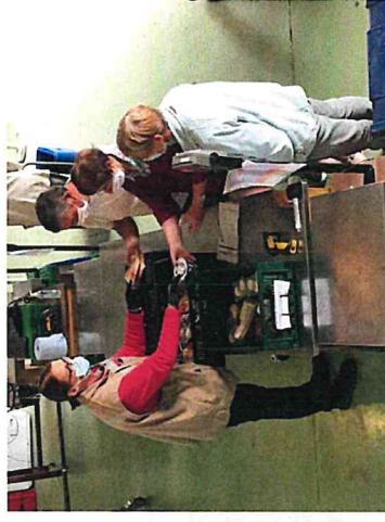
Adoption du mode DRIVE pour la distribution aux associations (ici EPICOM Noyal sur Vilaine).