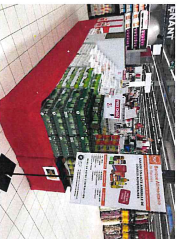
Bon exemple d'un îlot avec affiche informative.

La mise en œuvre de nouvelles actions de promotion des dons (sacs préparés, collecte dématérialisée, meilleure implication des magasins...) a dynamisé la Collecte Nationale des 27 et 28 novembre 2020 qui s'est pourtant déroulée dans un contexte sanitaire inédit. Grâce à la mobilisation de 3500 bénévoles répartis dans 146 magasins, elle a permis de récolter 255 tonnes de produits secs contre 176 tonnes en 2019, soit un bond de 45 %.