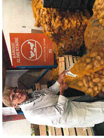
Don de pommes de terre d'un nouveau producteur "Le Gouessant" (Lamballe).

La crise du Covid a révélé une vision nouvelle de l'aide alimentaire et la nécessité de trouver des moyens nouveaux pour rapprocher l'offre et les besoins.